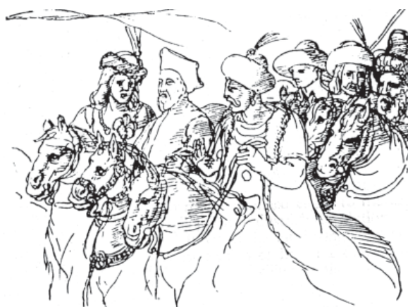
Группа грузинских всадников.