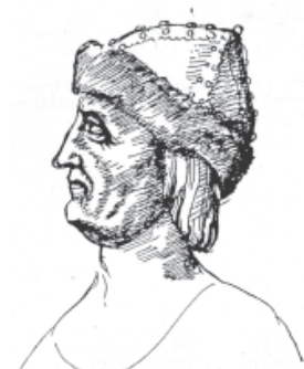
Христофор Каstellи. Портрет абазинского князя. 1650 год

получило повсеместное признание на Западе в первой половине XIX