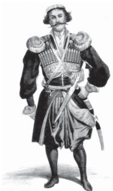
Слева Мингрельский князь. 1840-е годы. Из альбома князя Г. Гагарина