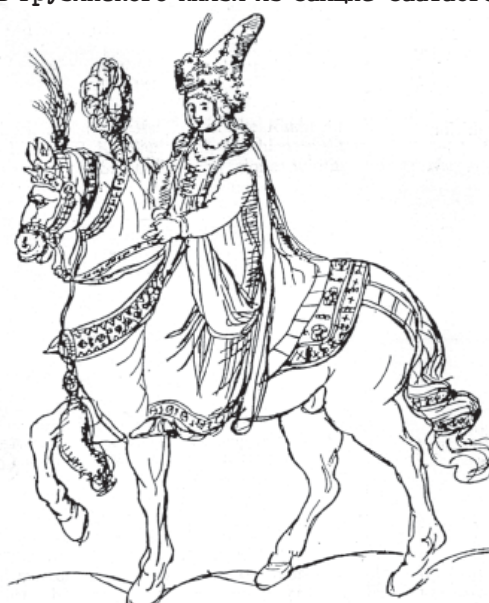
Христофор Каstellи. Персидская королева. Дочь грузинского князя из Самцхе-Саатабго