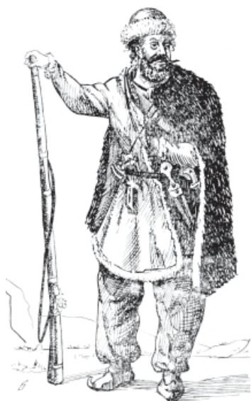
Слева Чеченец. Конец XVIII века Рисунок Бегтрова.