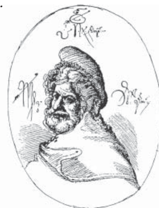
Христофор Каstellи. Портрет мингрельского князя Датуа Биска, погибшего в битве с абхазами. 1650 год