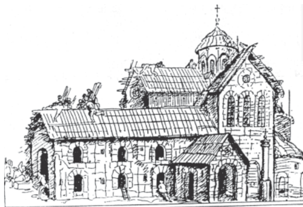
Пицундская церковь в XVII веке.

Великий современник Джевдета и Блуменбаха — Гегель — также пользовался определением «кавказская раса», считая итальянцев, грузин и черкесов (к последним он, видимо, относил и абхазов, и чеченцев — С.Х.) наиболее яркими представителями белого населения планеты. «Физиология различает, — отмечал Гегель, — кавказскую, эфиопскую и монгольскую расы. Физическое различие всех этих рас обнаруживается