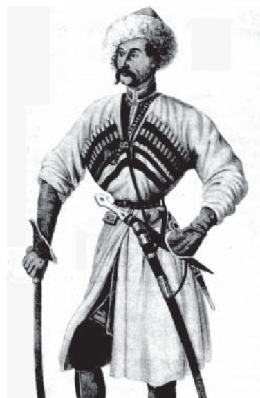
Справа Чеченец. Середина XIX века. Из альбома графа Г. Гагарина