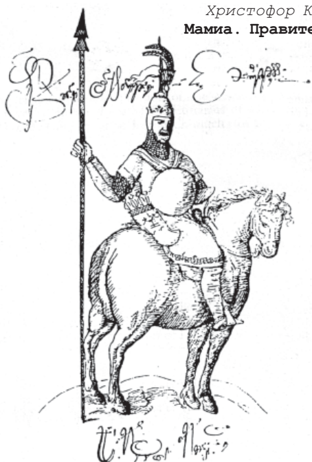
Христофор Каstellи. Мамия. Правитель Гурии